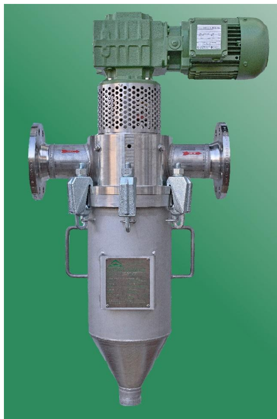
DELTA-STRAIN 480-S/L-KLS, 1.4571, 16 bar

⊕-Schutz ATEX-konform nach Richtlinie 2014/34/EU, perforierte Elemente für Gelpartikel, Fasern, Algen etc., gehärtete Filterelemente zur Verlängerung der Standzeit, federvorgespanntes Abstreifblech, selbstnachspannende Stopfbuchse, Sonderspannung, Spezialdichtungen, automatischer Schmutzaustrag, Austragsschleusen, Heizmantel, Differenzdrucküberwachung, Wandhalterung, TÜV-Abnahme etc.