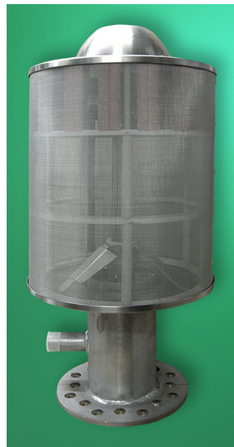
DELTA-SRAK, DN150, SS304