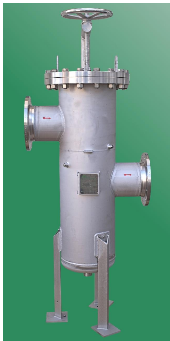
DELTA-SKB-20-V en acier inoxydable

Version EN LIGNE DELTA-SKB-I, indicateur de pression différentielle avec ou sans contact électrique pour la télétransmission, inserts magnétiques, robinetterie de vidange et de ventilation, exécution à haute pression, homologation par le TÜV, Largeurs nominales comme spécifié, Matériaux d'étanchéité/conception selon spécifications, matériaux spéciaux, revêtement intérieur, etc.